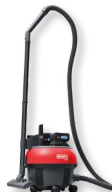
S10 Plus CAS