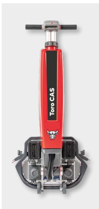
Cleanfix Toro CAS in Transportposition